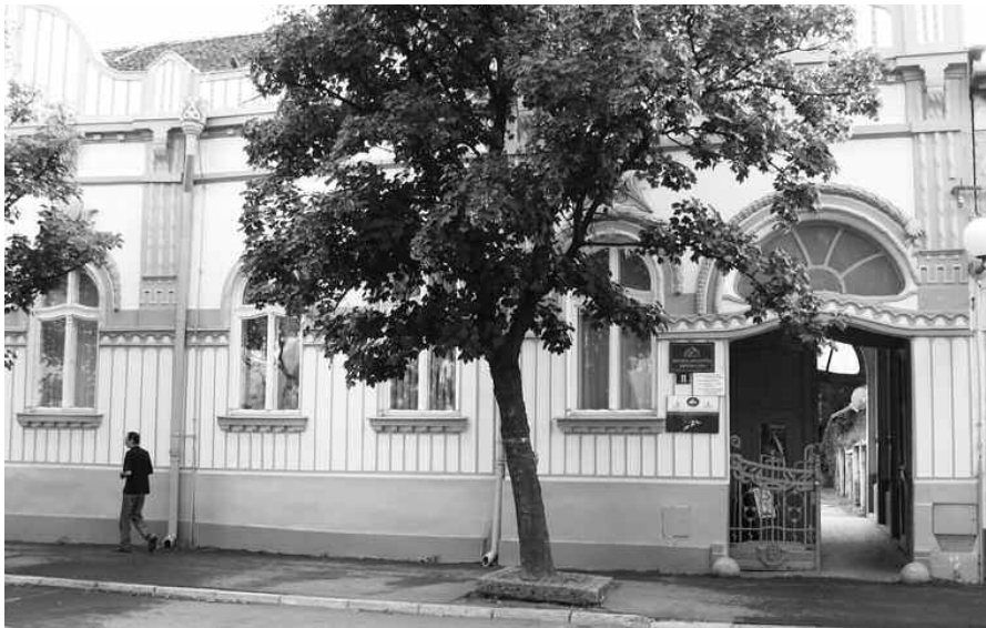
A becsei Népkönyvtár

gaiban az élethosszig tartó tanulás, az „életre tanulás“, az átképzés központi helyévé vált a könyvtár. Ez a funkcióbővülés mind a politikai hatalom, mind a társadalom egésze számára új lehetőségként jeleníti meg a könyvtárakat, amelyre azoknak a szolgáltatások bővítésével kell válaszolniuk. Megváltozott a kommunikációs és információs technológia is, a könyvtárak ma olyan információs és kommunikációs lehetőségeket nyújtanak, amelyek hamarosan olvasóink lehetővé válik, hogy az éppen adott könyvtár szolgáltatásain kívül a használók egy virtuális könyvtárban barangolhassanak a világ legjelentősebb könyvtári állományai és információi között.