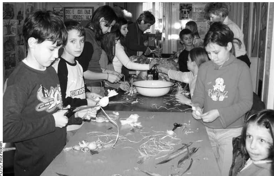
Kézműves műhelymunka a Népkönyvtárban

- A fiatalok szórakoztatása nincs megoldva. A gyerekek, akik szervezetten táncra járnak, minden iskolában szívesen mesélnek, milyen jó, hogy mehetnek táncolni, ismerkednek, utaznak... A becsei művelődési élet, főleg a